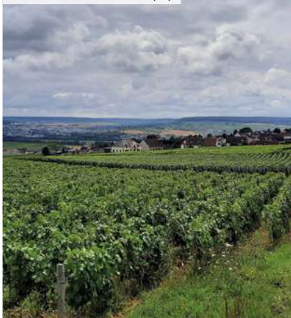
Lieudit Les Tahus - Hautvillers (51)

(3) Pour les non résidents, seuls les immeubles détenus en France sont pris en compte.